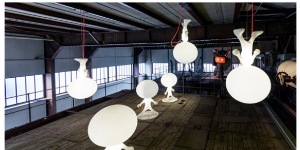
Red Dot Designmuseum, Essen

Uit deze twee musea kunt een keuze maken. In het Ruhrmuseum kunt u onder leiding van een gids een rondleiding krijgen van 90 minuten, waarbij u ook op plekken van het museum komt, die normaal niet vrij toegankelijk zijn.