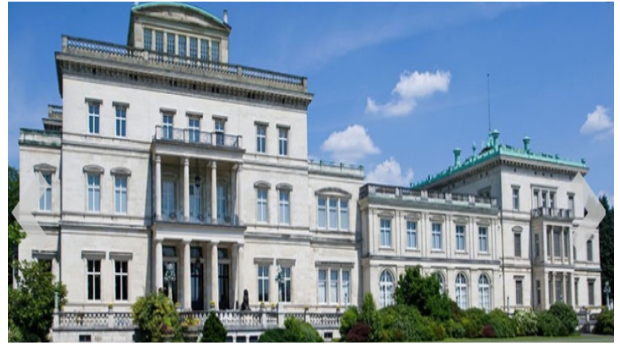
Villa Hügel, Essen